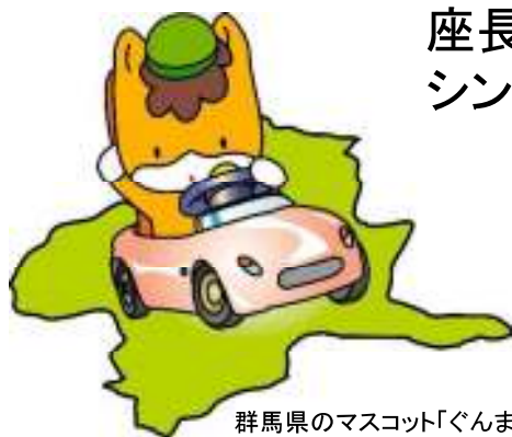
群馬県のマスコット「ぐんまちゃん」