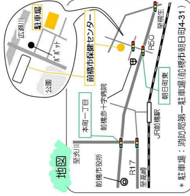
* 駐車場：消防局第一駐車場(前橋市朝日町4-31)

定員 先着60人 場所 前橋市保健センター4階 集団指導室 申し込み 下記までお電話下さい 申し込み期限 8/17(水) 保健予防課 こころの健康係 電話 027-220-5787